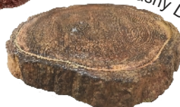
Barwa: Jasny Dąb