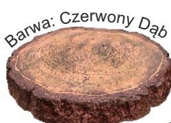
Barwa: Czerwony Dąb