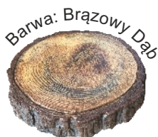
Barwa: Brązowy Dąb